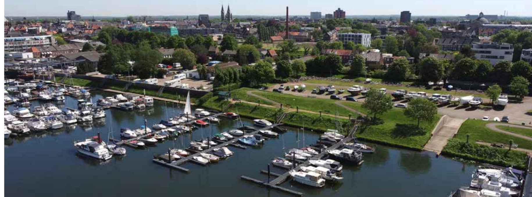
Zicht op het gebied Roerdelta fase 2.

Wil je onze nieuwsbrief ontvangen? Heb je woon- en leefwensen in deze nieuwe waterrijke woonwijk? Laat het ons weten en schrijf je in via www.roerdelta.nl .