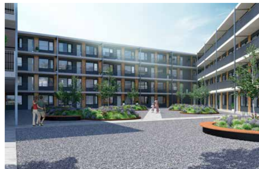
De binnentuin van 't Bastion.

Inmiddels is 60% van de 70 appartementen verkocht en dat is niet verwonderlijk. De appartementen zijn licht, ruim, voorzien van luxe keukens en badkamers, en hebben een groot balkon.