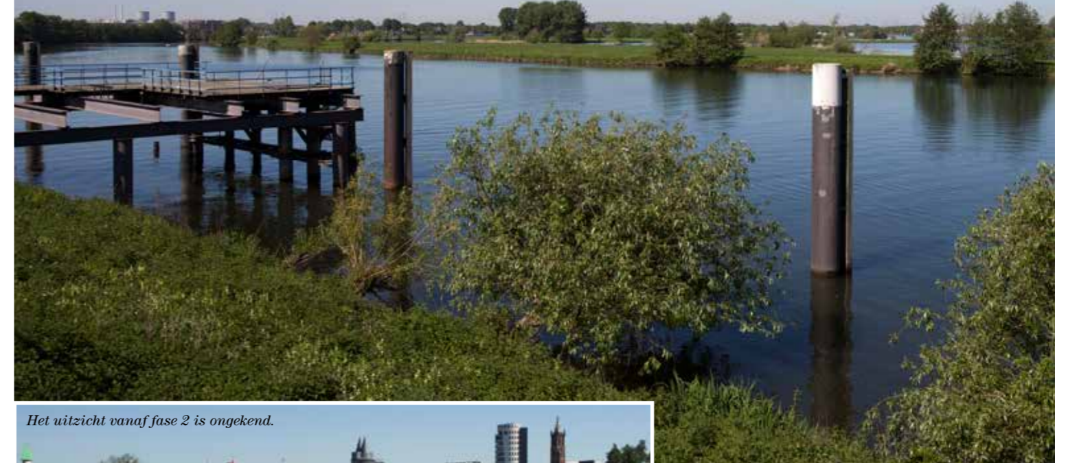
Het uitzicht vanaf fase 2 is ongekend.

De Roer vormt de grens tussen Roerdelta fase 1 en fase 2. De vorig jaar geplaatste nieuwe voetgangersbrug vanuit stadspark Akrocs is de wandelverbinding tussen beide woongebieden. Fase 2, waarvan de ontwikkeling weldra start, ligt pal aan de Maas. Het bijzondere gebied strekt zich uit van het voormalige Shell-eiland in het zuiden tot aan de Soleatoren, totaal ongeveer zes hectaren, ofwel zo'n 12 voetbalvelden groot. Er zijn zo'n 400 woningen voorzien. Medio vorig jaar hebben burgers samen met SDK Vastgoed en Gemeente Roermond geparticipeerd in een actief en ideeënrijk traject dat heeft geresulteerd in een vlekkenplan, een soort spelregelkaart voor het gebied. Verdere uitwerking hiervan zal in de tweede helft van 2018 plaatsvinden, eveneens met burgerparticipatie. Roerdelta fase 2 wordt een mooie mix van grondgebonden koop- en huurwoningen en appartementen, voor jong en oud, van starters tot senioren. Eind 2019 worden de eerste deelplannen in verkoop gebracht.